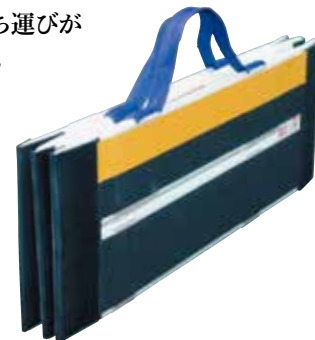
デクパック 70 3ツ折りタイプ

簡単に折りたたみができ、持ち運びが 容易で簡単にセットできます。 軽くて強く表面には特殊な すべり止め加工が 施されています。